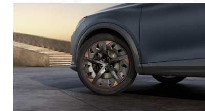
19" Exclusive 38/6 Aero Sport Black/Copper – P8W