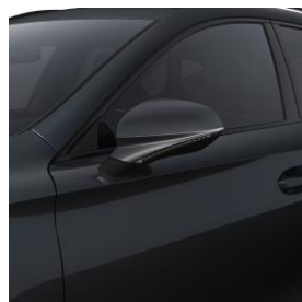
Magnetich Tech / S7S7