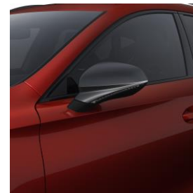
Desire Red / E1E1