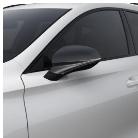
Candy White / B4B4