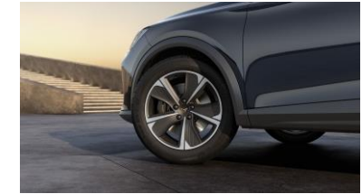
18" Performance 38/1 Sport Black/Silver – PUK