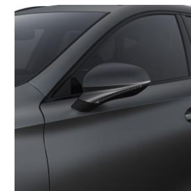
Magnetich Tech M / 9R9R