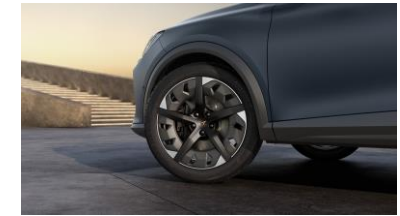
19" Exclusive 38/4 Aero Sport Black/Silver – P8V