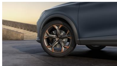
19" Exclusive 38/5 Sport Black/Copper – PYA