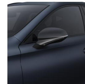
Petrol Blue M / Q4Q4