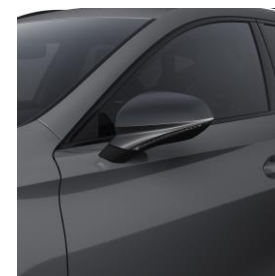
Graphene Grey / R6R6