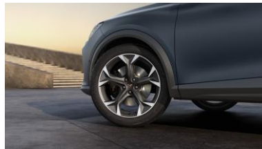
19" Exclusive 38/3 Sport Black/Silver – PUW