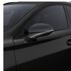
Midnight Black / OE0E