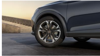
18" Performance 38/2 Sport Black/Silver – PUL