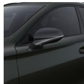
Dark Camouflage / 9S9S