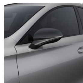
Urban Silver / L5L5