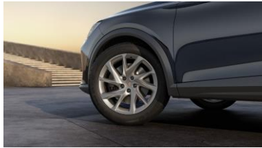
18" Performance Silver standard Formentor