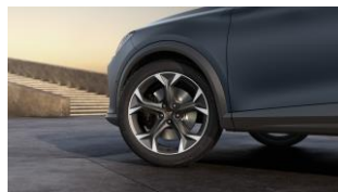
19" Exclusive 38/3 Sport Black/Silver – PUW