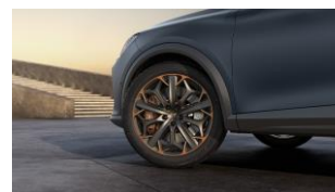
19" Exclusive 38/7 Sport Black/Copper – PYB 19" Exclusive 38/9 Sport Black/Copper – PYE