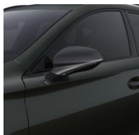
Dark Camouflage / 9S9S