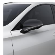
Nevada White / 2Y2Y