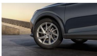
18" Performance Silver standard Formentor