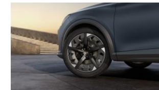
19" Exclusive 38/4 Aero Sport Black/Silver – P8V