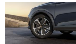
18" Performance 38/1 Sport Black/Silver – PUK