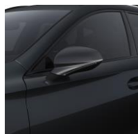
Magnetich Tech / S7S7