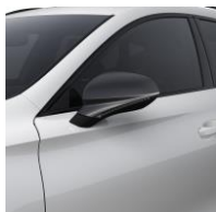
Candy White / B4B4