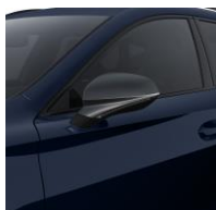
Asphalt Blue / 5U5U