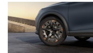
19" Exclusive 38/6 Aero Sport Black/Copper – P8W