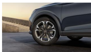
18" Performance 38/2 Sport Black/Silver – PUL