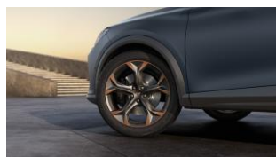
19" Exclusive 38/5 Sport Black/Copper – PYA 19" Exclusive 38/10 Sport Black/Copper – PYF