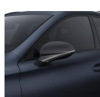
Petrol Blue M / Q4Q4