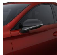
Desire Red / E1E1